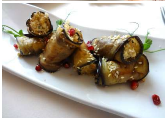
Рулетики из баклажан с сырной закуской, грецким орехом и гранатом