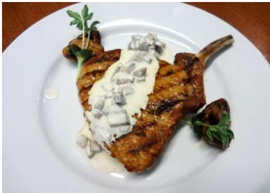
Корейка на кости со сливочно-грибным соусом 220/30г/890р