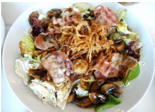
Теплый салат с грибами салатным миксом, жареным беконом, луком фри и шампиньонами в соусе терияке