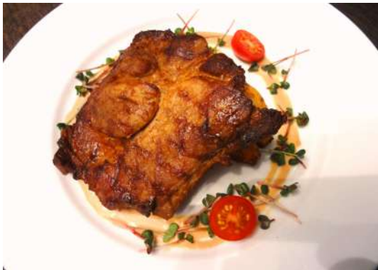
Стейк из свиной шеи в классическом шашлычном маринаде 160г/890р