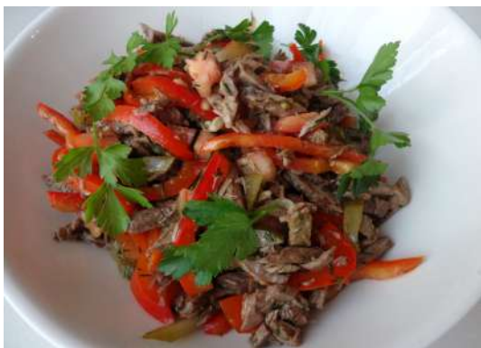
Салат с телятиной и маринованными овощами