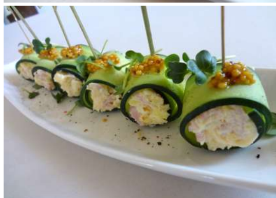
Рулетики из свежего огурца с сыром и ветчиной