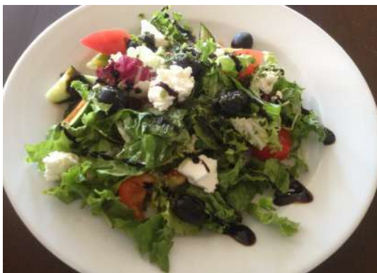
Классический греческий салат

из свежих овощей, сыра фета, с чесночной заправкой под соусом крем бальзамик