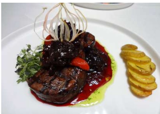
Свиная вырезка маринованная с красным луком 140г/890р