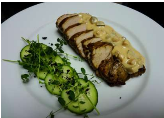
Свиная вырезка с охотничьим соусом 145/30г/890р