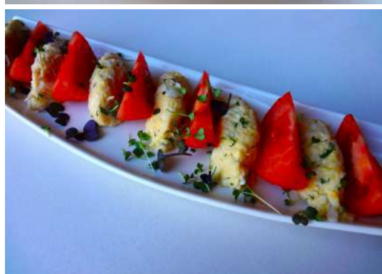
Еврейская закуска со спелыми томатами