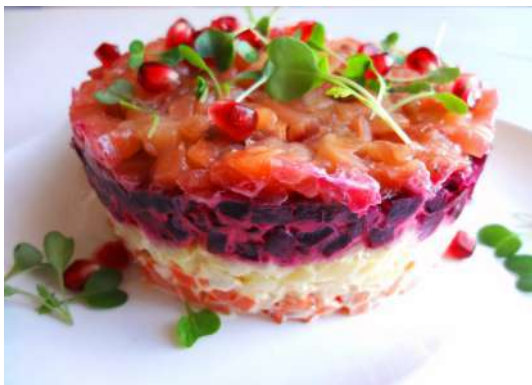
Семга "под шубой"