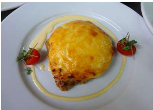
Отбивная из свиной корейки запеченная под шапкой из паприки моркови, лука и сыра 210г/890р