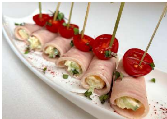
Рулетики из ветчины с сыром