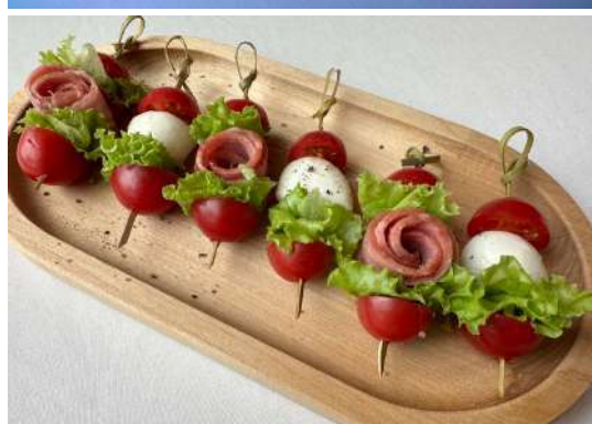
Ассорти на шпажках