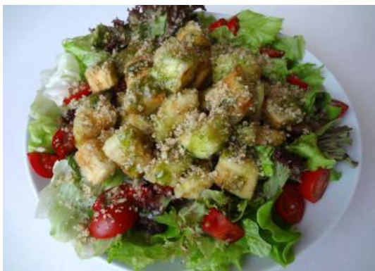
Салат с хрустящими баклажанами и свежими овощами в грузинском стиле